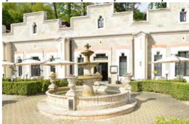
nemporecabor a aut aspicae sam, atur, que officabor aut utati verum quatibus explis