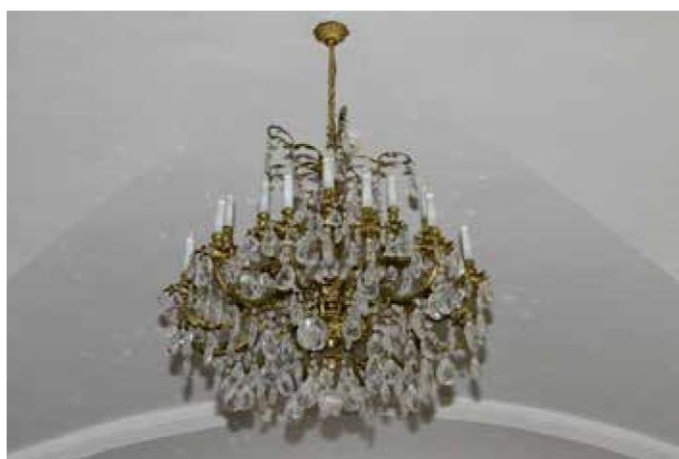
nemporecabor a aut aspicae sam, atur, que officabor aut utati verum quatibus explis veCiandam