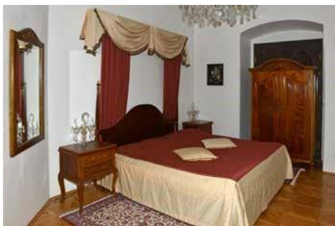
nemporecabor a aut aspicae sam, atur, que officabor aut utati verum quatibus explis veCiandam

označuje bývalé schwarzenberské zaměstnance jako soudruž-