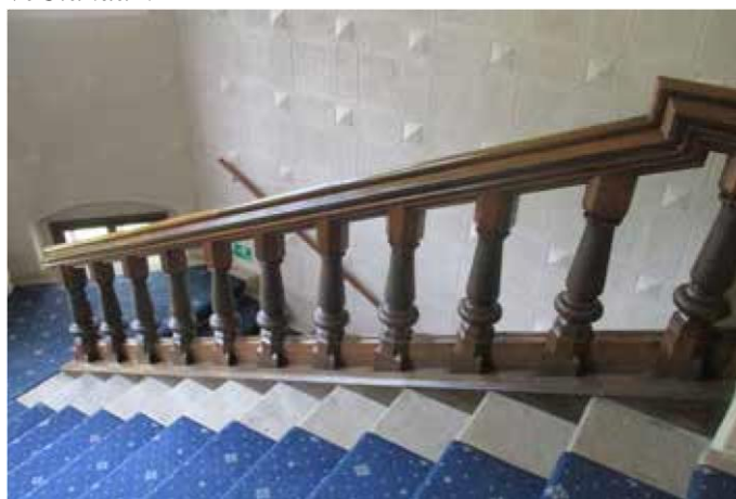
nemporecabor a aut aspicae sam, atur, que officabor aut utati verum quatibus explis veCiandam